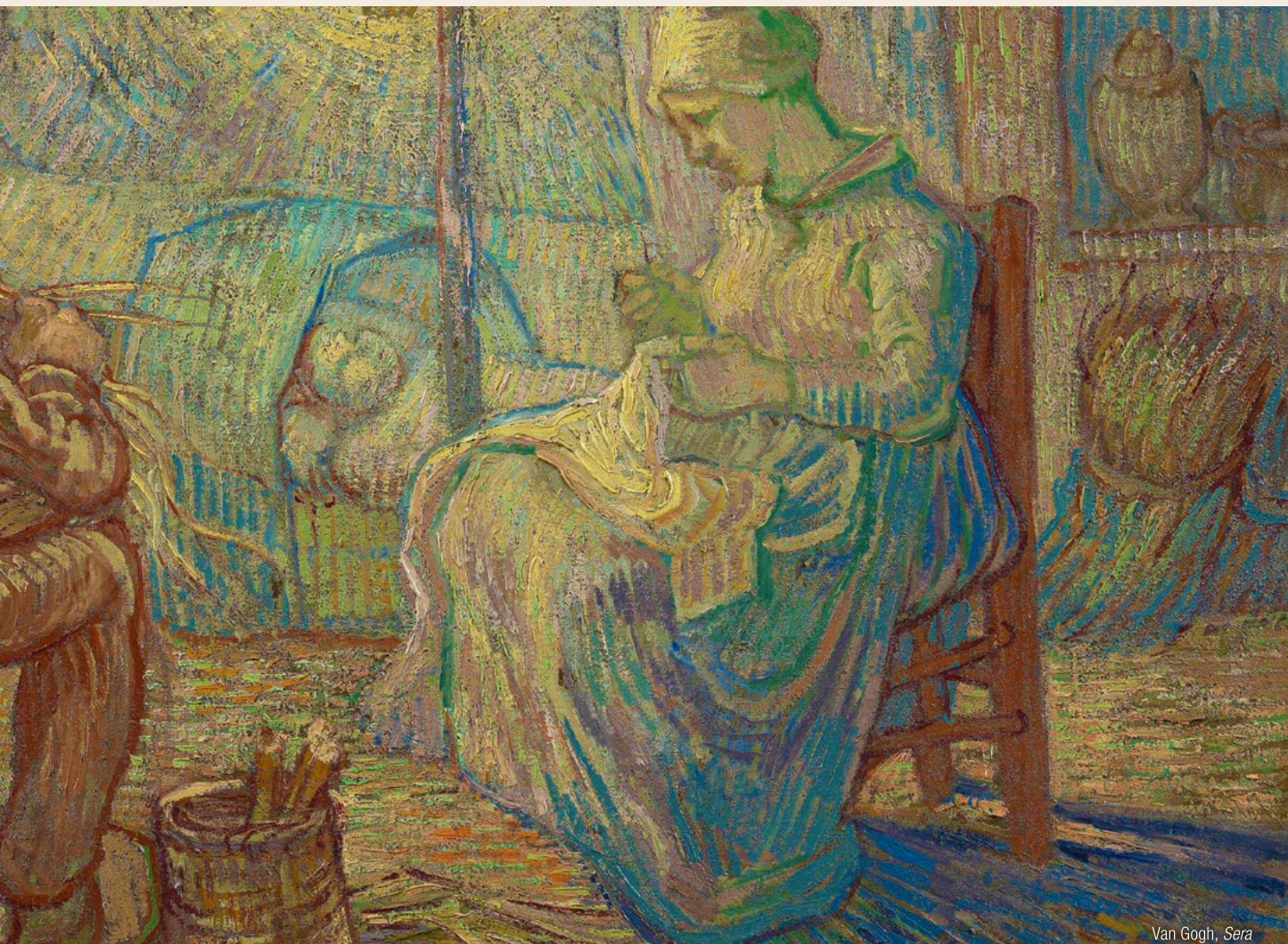
Van Gogh, Sera

Così li descrive il Manzoni nell'inno Il Natale , che abbiamo già citato all'inizio: "Senza indugiar, cercarono / l'albergo poveretto / que' fortunati (sono