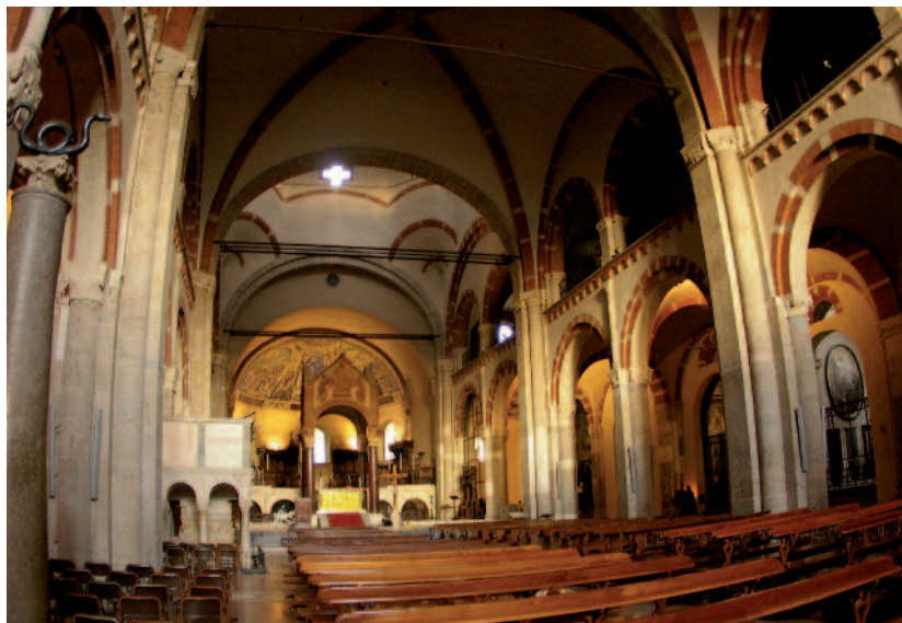
Nelle pag. precedenti e accanto: alcuni particolari della Basilica di Sant'Ambrogio a Milano