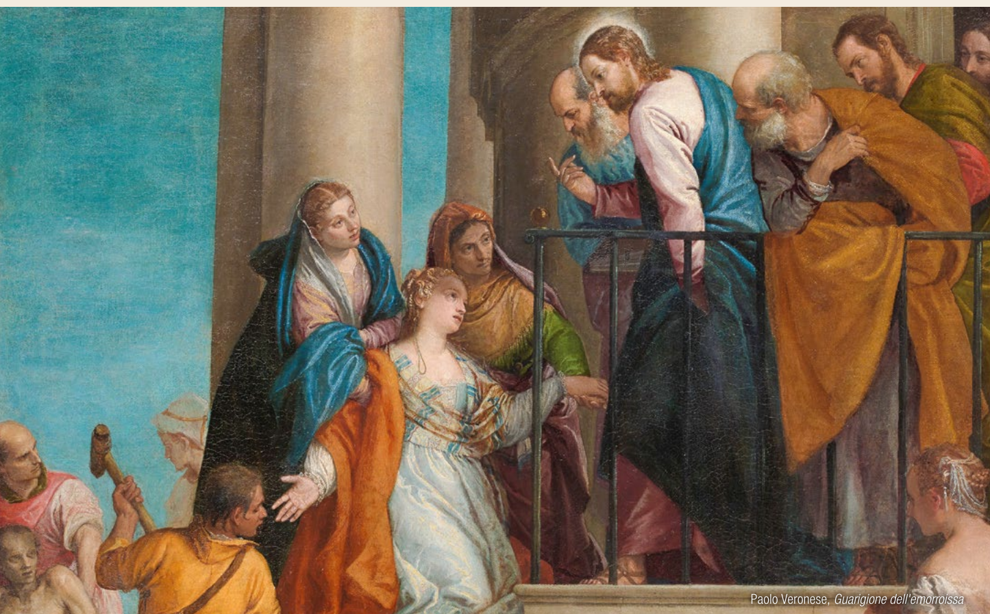
Paolo Veronese, Guarigione dell'emorroissa

Questa donna è, ancora una volta, la testimonianza che anche per la fede di un istante, anche per il desiderio di un attaccamento di un istante a Gesù,