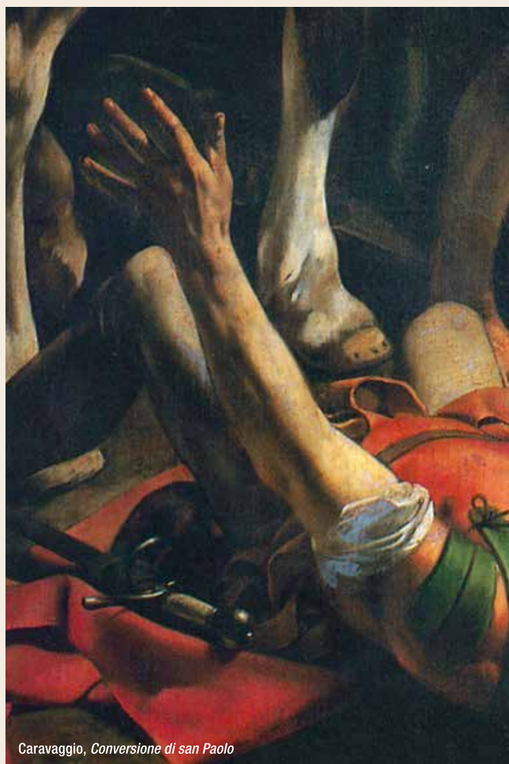
Caravaggio, Conversione di san Paolo

le nostre esigenze, proviamo a ritrovarci ora con quell'apertura che abbiamo davanti ai nostri occhi, un'apertura evidentemente tutta spalancata ad attendere e a mendicare. Ma chi o che cosa? Quelle braccia spalancate - in quell'evidente atteggiamento di assoluta apertura - mi aiutano a mostrarvi l'atteggiamento del cuore del povero di spirito come quello di un uomo che non attende e non mendica